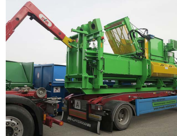
AVOS 1211 mit Hakenuntergestell