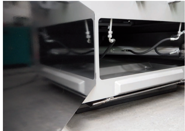
Selbstreinigungswanne im Presskopf